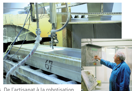
Entreprise Varicor à Wisches : la coulée des plaques. De l'artisanat à la robotisation...

L'évaluation des risques chimiques a permis à l'entreprise Varicor de réduire la quantité de solvants par 3 en 5 ans avec un objectif pour 2010 de la diviser par 20. «Le médecin du travail a un rôle central de par son expertise médicale pour analyser les postes sous l'angle de la santé de l'individu et repérer les pathologies liées au travail.» Docteur Valérie Schach, Toxicologue.